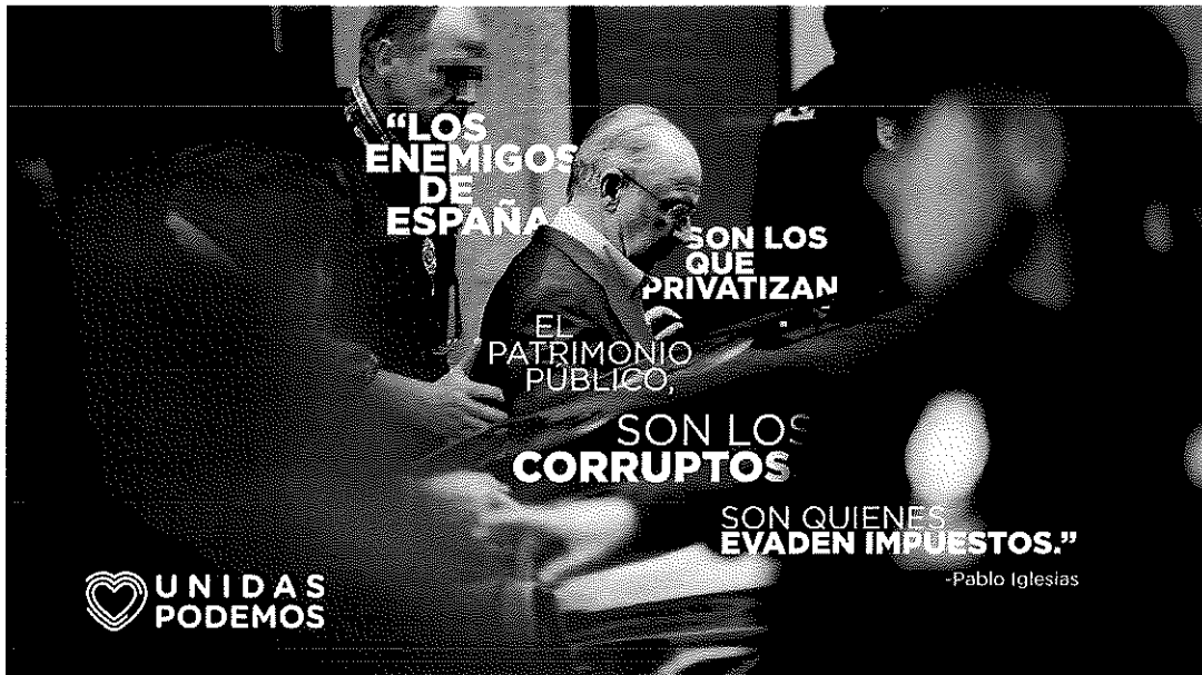
Fotografía número 20 40