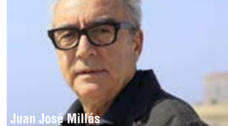
Juan José Millás