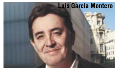
Luis García Montero