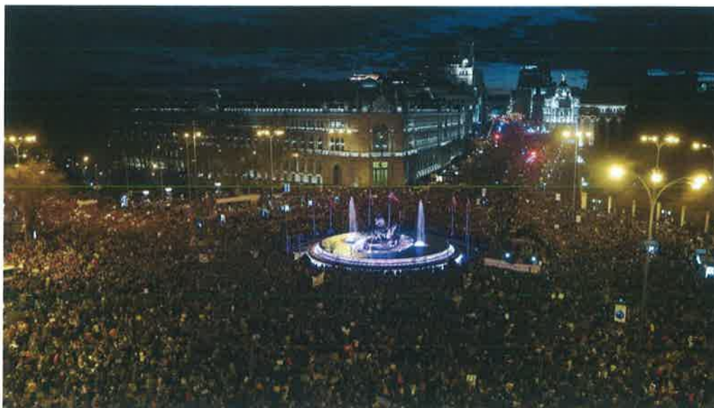
Personas con contacto muy estrecho Plaza de Cibeles, 8 de marzo de 2019 Diario El País

Y no porque lo diga la OMS, ni siquiera la ministra Montero, sino que forma parte del conocimiento popular, "las concentraciones de personas en contacto estrecho facilitan la transmisión de enfermedades infecciosas respiratorias" y más aún si es en espacios cerrados.