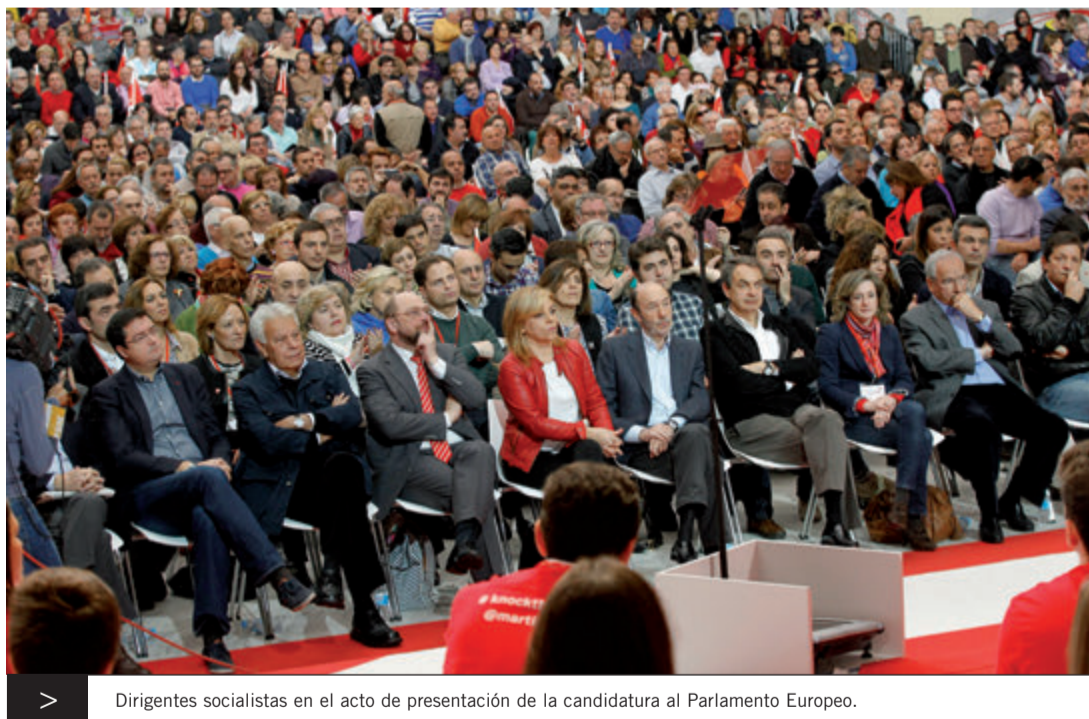
> Dirigentes socialistas en el acto de presentación de la candidatura al Parlamento Europeo.

La fuerza de ese voto puede, de igual forma, acabar con los paraísos fiscales y defender el modelo europeo de derechos sociales y de libertades públicas que la derecha está haciendo saltar por los aires. El objetivo no es otro que ganar en España y en Europa, para que haya una mayoría socialista y socialdemócrata en el Parlamento Europeo que haga realidad ese giro de Europa, dejando atrás la etapa de austericidio que nos ha conducido a donde estamos: un retroceso sin precedentes, desde