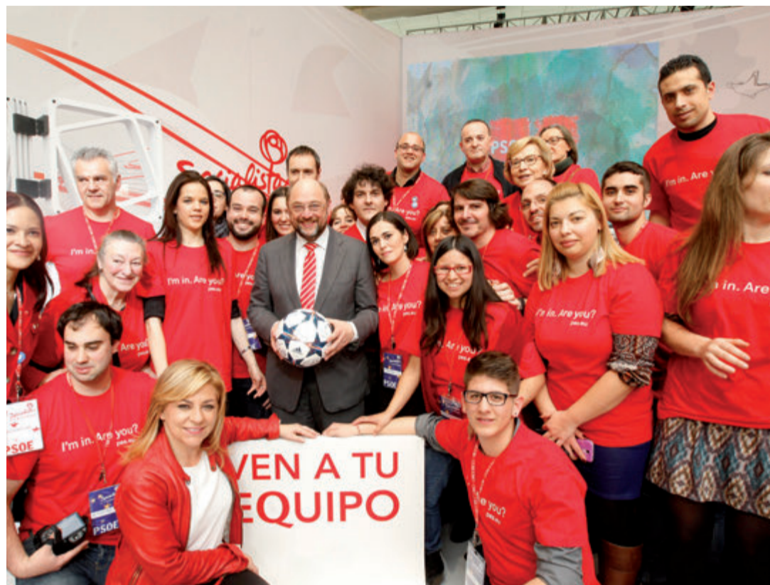
Elena Valenciano y Martín Schulz junto a un grupo de militantes y simpatizantes socialistas.

Los escaños se reparten entre los países de la Unión según el prin-