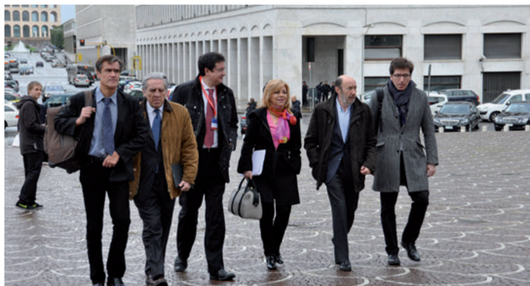
Parte de la delegación española a su llegada al Palazzo dei Congressi, donde se celebró el Congreso del PSE.

empresas, además de promover la innovación tecnológica y sostenible.