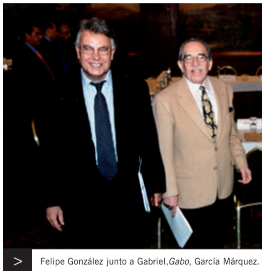
Felipe González junto a Gabriel, Gabo, García Márquez.

También se nos ha ido un amigo del alma, el escritor y premio Nobel de literatura Gabriel García Márquez, un genio de la literatura universal a la altura de los más grandes. Gabo era un hombre bueno, sencillo y cordial que trabajó siempre por la libertad, dignificó el periodismo y por donde pasaba dejaba huella de sus pasiones, la escuela de periodismo en Cartagena de Indias, la escuela de cine en San Antonio de los Baños en Cuba... Sin embargo no permitió que Cien años de soledad fuese llevada al cine porque quería que cada lector pusiese rostro a sus protagonistas y los hiciese suyos: "si dejo que Sofía Loren interprete a la mamá Ursula, la jodí", me dijo un día en su casa de Cuernavaca. Tenía razón, el rostro de mamá Ursula sería para siempre el de Sofía Loren, no el de la madre o la abuela de cada uno de nosotros. Su lección de vida ha sido más importante para sus amigos que su maestría literaria. ¡Gracias!